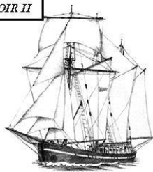
BEL ESPOIR II

Et ils sont nombreux à vouloir embarquer pour vivre cette aventure.... !